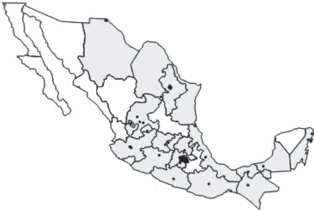
Figura 2. Unidades de CIJ en las que la población atendida reporta porcentajes de uso de crack alguna vez en la vida superiores a la media nacional (24.8%). Segundo semestre de 2010.

existencia de algunas diferencias significativas. En primer lugar, los usuarios de crack como sustancia de mayor impacto presentan una proporción significativamente mayor de hombres y menor de mujeres (89.3 y 10.7%, respectivamente) que los usuarios de cocaína (84.1 y 15.9%); asimismo, comprenden un mayor porcentaje de desempleados (32.3 vs. 22.8%) y un menor porcentaje de estudiantes activos (6.9 vs. 15.1%).